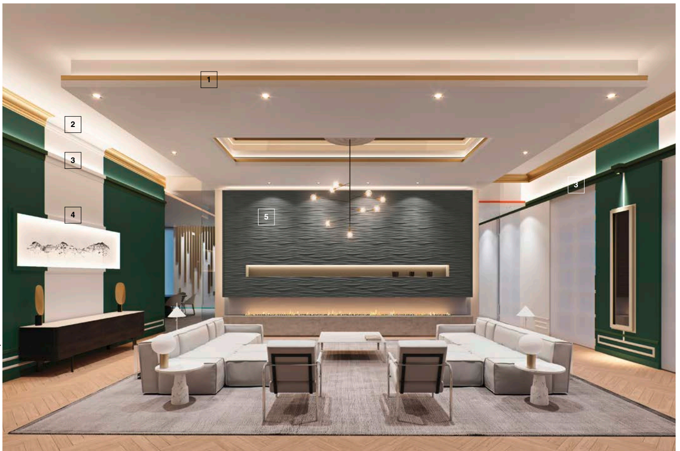
1 IL5 | 2 Z40 | 3 IL9 MEMORY | 4 IL6 | 5 LIQUID

Photo: © NOËL & MARQUET by nmc / INTERIOR DESIGN PROJECT #michaëlbhainstudio