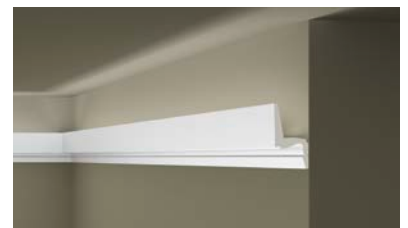
IL7 MEMORY ARSTYL®