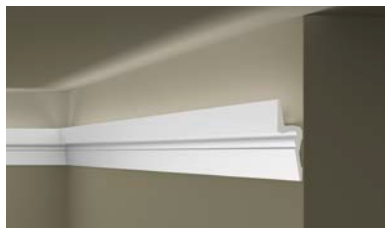
IL9 MEMORY ARSTYL®