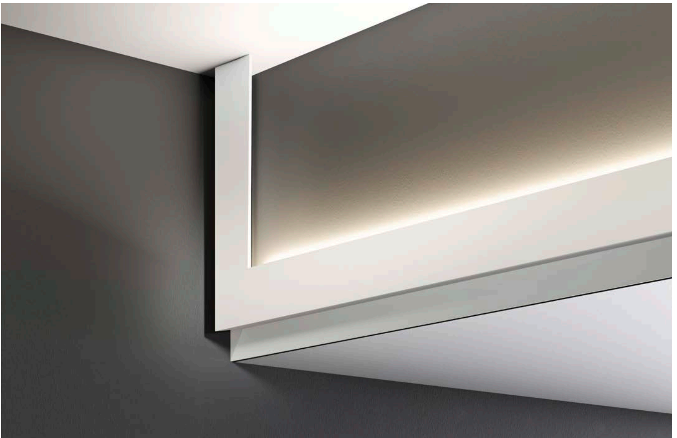
INTERIOR DESIGN PROJECT #michaelbihainstudio

Der Red Dot Award: Product Design bietet Designern und Herstellern aus aller Welt eine Plattform für die Bewertung ihrer Produkte. 2020 reichten Gestalter und Unternehmen aus 60 Nationen mehr als 6.500 Produkte zum Wettbewerb ein. Die internationale Jury, bestehend aus erfahrenen Experten unterschiedlicher Fachbereiche, kommt bereits seit rund 65 Jahren zusammen, um die besten Gestaltungen ausfindig zu machen. Der mehrtägige Bewertungsprozess fußt auf zwei essentiellen Kriterien: Die Juroren probieren sämtliche Einreichungen aus, um neben der Ästhetik auch die ausgewählten Materialien, die Verarbeitung, die Oberflächenstruktur, die Ergonomie und die Funktionalität beurteilen zu können. Erst nach intensiven Diskussionen fällen sie eine Entscheidung über die gestalterische Qualität der Produkte. Getreu dem Motto „In search of good design and innovation“ erhalten lediglich die besten Entwürfe eine Auszeichnung.